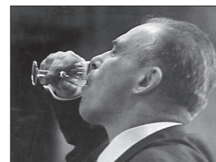
«С Днем геолога!»