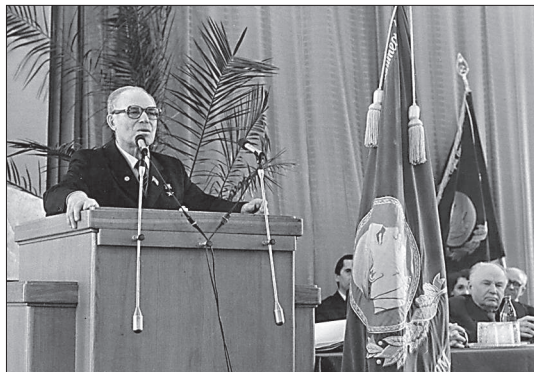
А.А. Трофимук докладывает коллективу о результатах годовой деятельности ИГиГ. 1984 г.