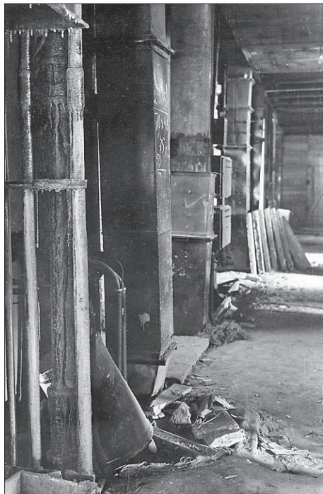
Так выглядели коридоры ИГиГ в 1959 г.

Более года в Академгородке функционировал лишь один корпус-первенец – Институт гидродинамики (ИГ). В нем находились также лаборатории ИТПМ и ряда других институтов, но значительная часть сотрудников, получивших жилье в городке, продолжали еще ездить на работу в город, причем возили бесплатно. В семь утра – отправление кавалькады служебных автобусов от ИГ в город, на Советскую, 20 (18). Бердское шоссе тогда перестраивали, расширяли, так что ездить приходилось то по уже проложенной бетонке, то по разбитым обочинам – в объезд. Поездка в переполненных маленьких и холодных автобусах занимала около двух часов в один конец. Все мы знали друг друга, и не припомню случая, чтобы в автобусах мужчины сидели, а женщины стояли. Вечером от городской площади в 18.00 мы отправлялись в обратный путь. Постоянно действующих рейсовых автобусов не было – в кино или театр не сходить, последних задержавшихся на работе сотрудников забирал один рейс в 20.00, частные машины можно было сосчитать по пальцам.