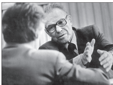
Умение установить хороший контакт с собеседником