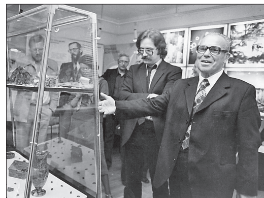
А.А. Трофимук на выставке геологического музея ИГиГ в Хельсинки. 1981 г.