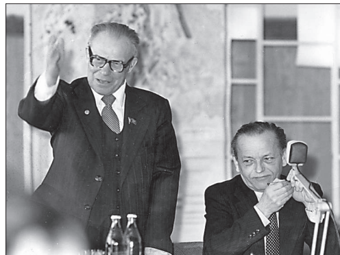
Академики А.А. Трофимук и В.А. Коптюг

Регулярно, два-три раза в год, Андрей Алексеевич выступал перед коллективом института с отчетами как директор и как депутат Верховного Совета РСФСР. Кроме того, встречался с коллективом по праздникам и непременно в День геолога, на профсоюзных и открытых партсобраниях и т. д. Он не был красноречив, более того, его выступления порой казались тяжеловатыми, особенно в первые минуты, но всегда были эмоциональными, доходчивыми, убедительными и конструктивными. В обиходе он умел работать с людьми разного ранга и служебного положения – от рабочего до академика. А руководить институтом, где одновременно работали десять членов Академии – выдающихся представителей советской геологии, в те годы было по силам, наверное, только А.А. Трофимуку.