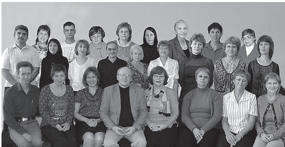
Коллектив Академического издательства «Гео». 2009 г.