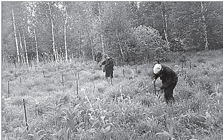
Устройство заземлений металлическими штырями, связанными между собой проводами. Болотное, 1968 г.

где условия для опытных приборов были чрезвычайно благоприятными: скважины глубиной до 2000 м с температурами на забое не более 50 °С. Были не только успехи. Однажды, когда мы завершали работы в Татарии с двухзондовой аппаратурой диэлектрического и высокочастотного индукционного каротажа, нас пригласили в Саратовское Поволжье для проведения опытных работ на нефтяном промысле под эгидой геофизиков, базировавшихся в Волгограде. Мы быстро переехали – два автомобиля с каротажной станцией АЭС и опытным прибором для исследования скважин.